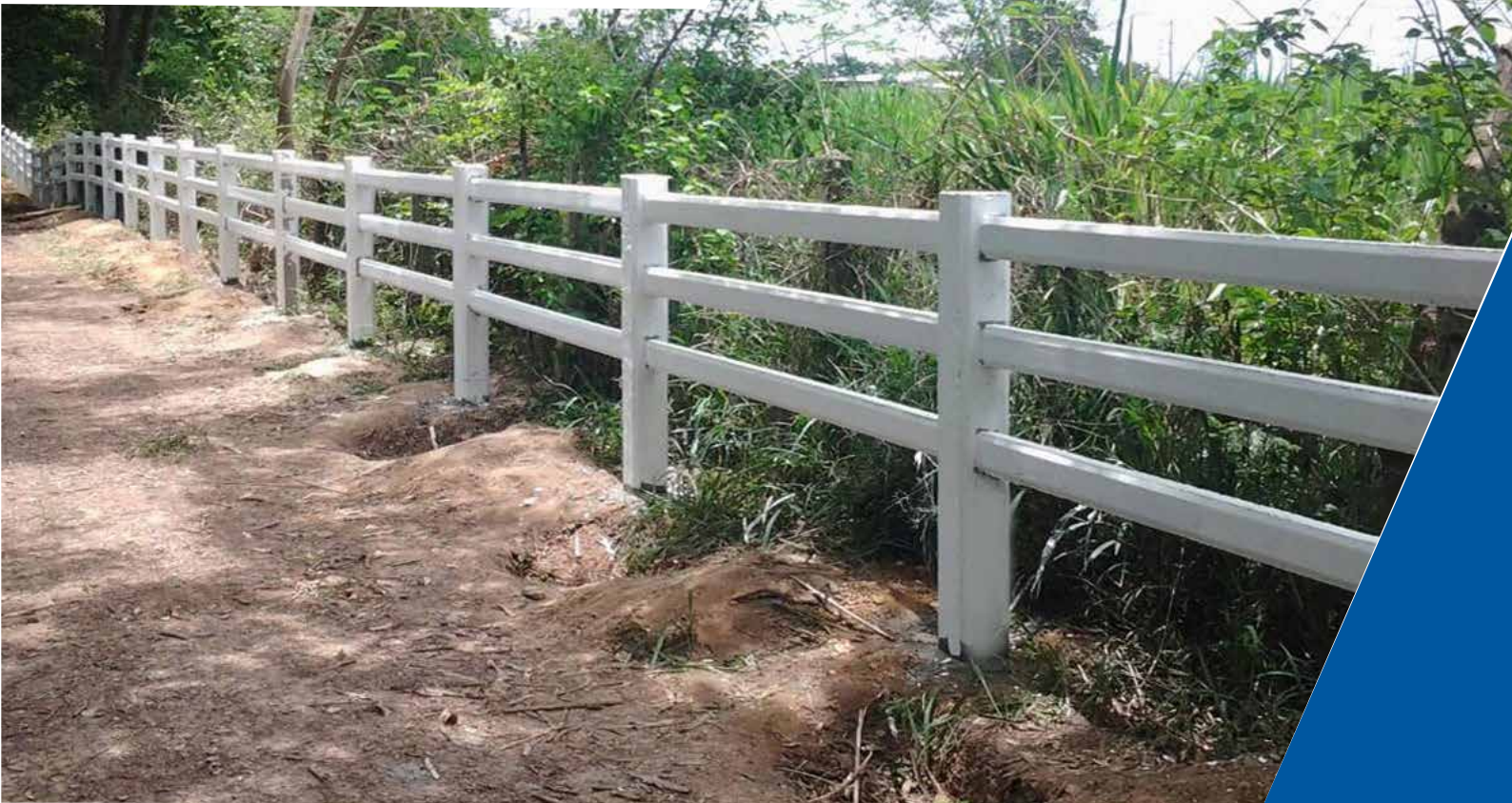
รั้วคานบอย พีซีซี ทางเลือกใหม่สำหรับงานรั้ว ติดตั้งง่าย ได้มาตรฐาน แข็งแรงทนทาน และสวยงาม